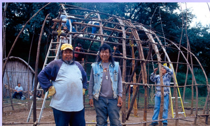
Hombres kikapú construyendo una casa de invierno. El Nacimiento, Múzquiz, Coahuila. Fernando Rosales, 2005. Fototeca Nacho López del INPI.

* La † con la que están marcadas algunas lenguas significa que ya no tienen hablantes, es decir, que son una lengua muerta. [N. de la E.]