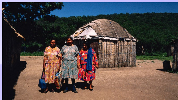
Mujeres kikapú afuera de una casa de verano. El Nacimiento, Múzquiz, Coahuila. Graciela Iturbide, 1981. Fototeca Nacho López del INPI.